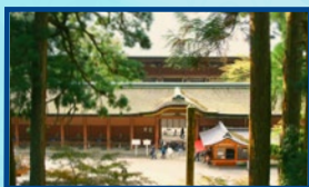
히에산에 있는 엔랴쿠지