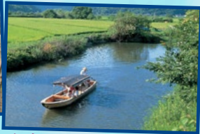
수이고 매구리 보트 라이드 근사한 풍경!