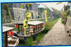
오우미하치만 보트 라이드 전통적 마을거리!